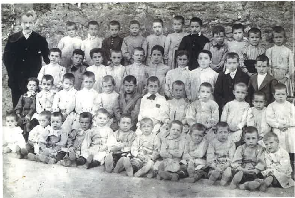
Foto escolar del curs 1912-13.