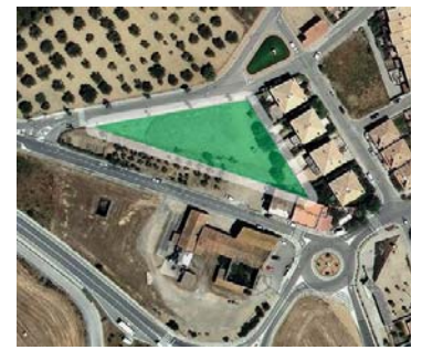
Aquest és el terreny de 1.946m 2 , qualificat com a zona d'equipaments, que s'habilitarà com a aparcament.

L'Ajuntament aplanarà i compactarà el ferm d'un solar municipal que hi ha a l'entrada del poble -al costat de ca la Júlia- per convertir-lo en una zona d'aparcament (7.433,47€). Abans de final d'any també es destinaran 21.370,66€ a netejar les lleres de totes les rieres que passen per la trama urbana del poble.