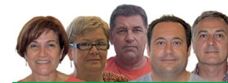
Equip de govern Gent de Palau-Acord Municipal Alternativa per Tothom

La tergiversació de la informació és una eina potent i perillosa. Contrastar la informació és una actitud intel·ligent i responsable. L'arma del l'antic govern a Palau-saverdera continua sent la confusió i la manipulació dels fets.