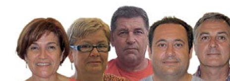
Equip de govern Gent de Palau-Acord Municipal Alternativa per Tothom

També és de responsabilitat analitzar com podem afrontar les situacions irregulars d'algunes indústries que hi ha la carretera de Palau a Roses. Tenint en compte que la zona industrial no està consolidada i que existeix el Pla director de la serra de Rodes que afecta el nostre municipi i els del voltant, la feina serà complicada. S'ha contractat una professional, que col·laborarà amb la feina que fa l'inspector municipal d'obres i ja han començat a treballar.